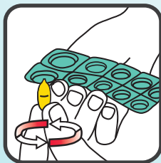
Tablette abdrehen und einnehmen